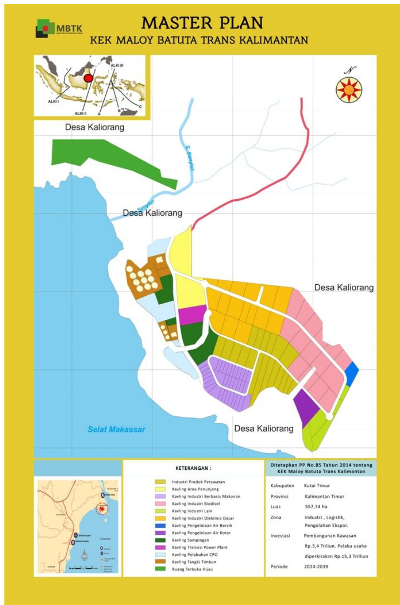
Gambar II.1. Master Plan Kawasan Ekonomi Khusus Maloy Batuta Trans Kalimantan